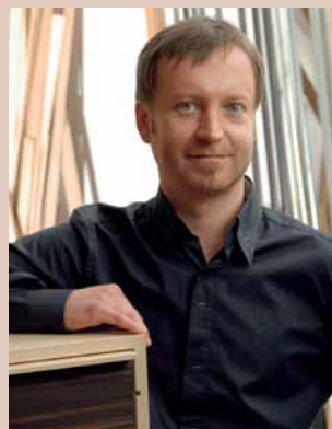
Porträt mit „macassar“ Schränkchen, 2007, Foto: Stefan Schmidbauer