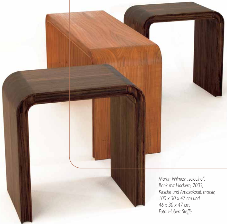
Martin Wilmes: „soloUno“, Bank mit Hockern, 2003, Kirsche und Amazakoué, massiv, 100 x 30 x 47 cm und 46 x 30 x 47 cm

Die Arbeit mit Furnier und Vollholz ist nicht neu, ganz im Gegenteil: Sie entspricht der Technik der alten Meister in der vorindustriellen Zeit, die noch keine Tischlerplatten kannten. Aber man sollte sich hüten, Wilmes Möbel als altmeisterlich zu bezeichnen. Zu modern ist ihre Anmutung mit dem klaren Farbkontrast des durch die