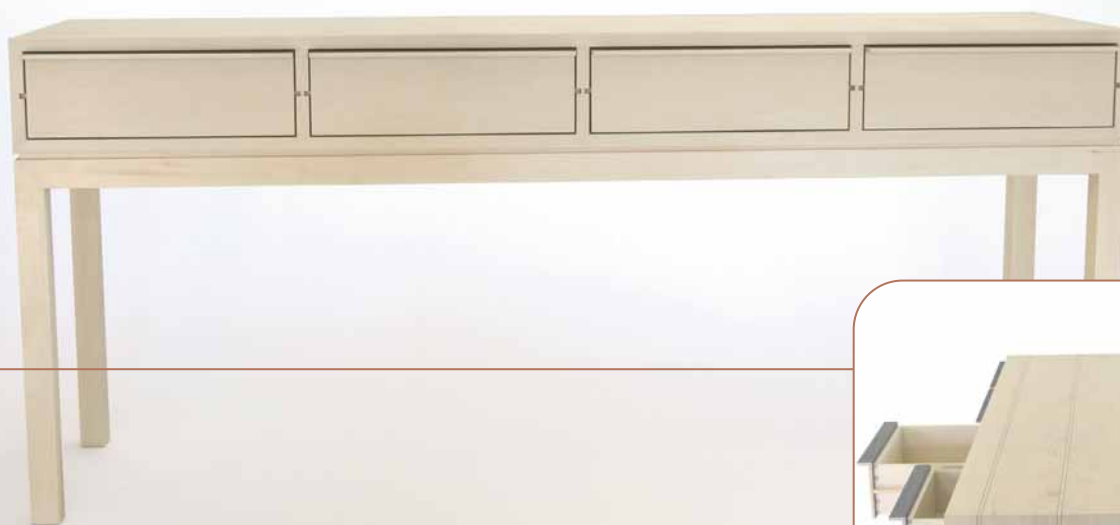
Martin Wilmes: Sideboard „macassar“, Rückansicht, 2006, europäischer Ahorn und Macassar-Ebenholz, 155 x 40 x 68 cm