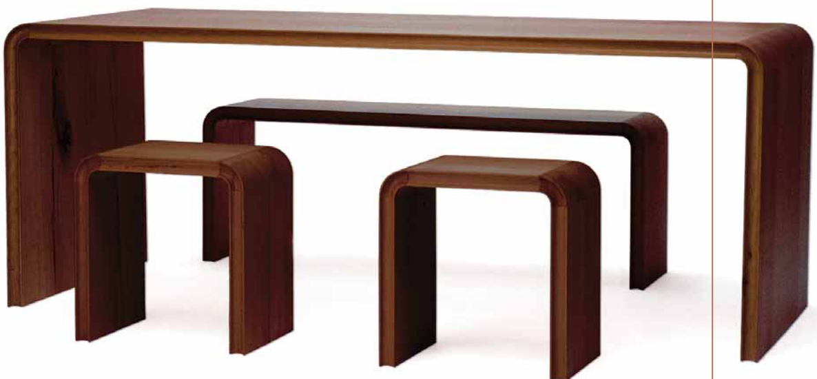
Martin Wilmes: „soloUno“, Tisch mit Bank und Hockern, 2004, Nussbaum, massiv, 207 x 75 x 75 cm