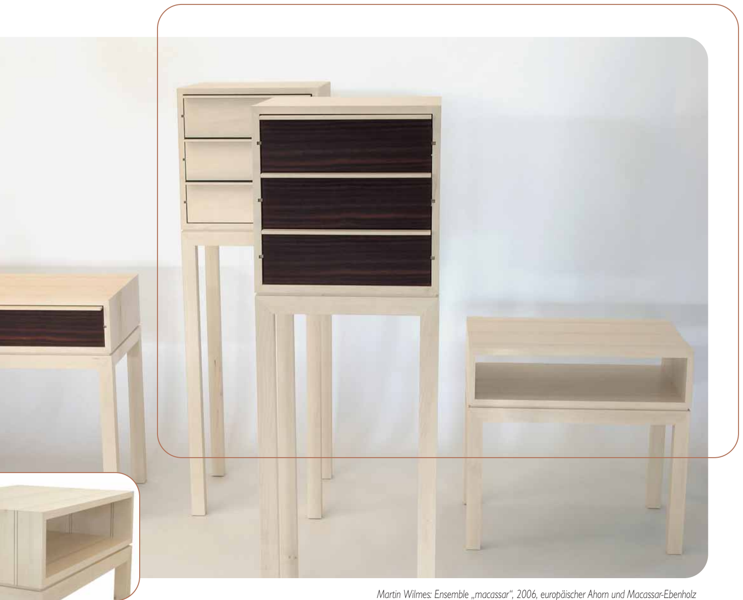
Martin Wilmes: Ensemble „macassar“, 2006, europäischer Ahorn und Macassar-Ebenholz