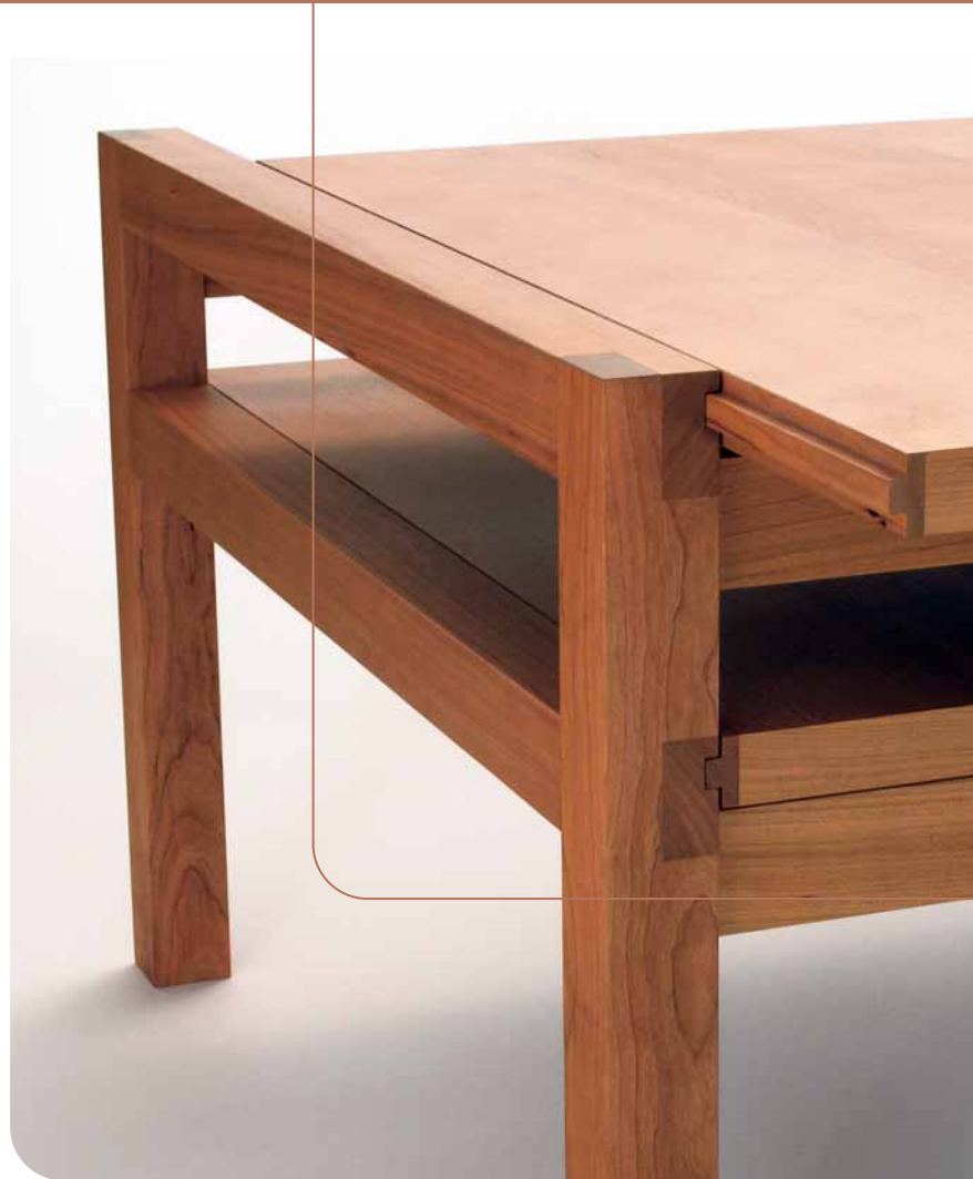
Martin Wilmes: Couchtisch mit verschiebbaren Platten, 2006, amerikanischer Kirschaum, 80 x 80 x 55 cm