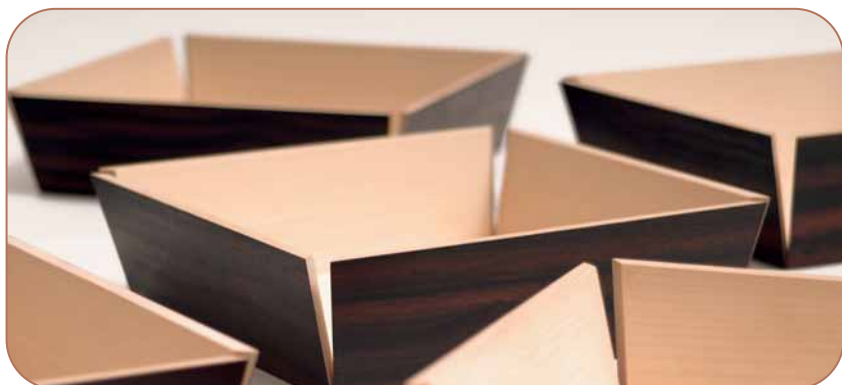
Martin Wilmes: Obstschale „Macassar“, 2007, Macassar-Ebenholz und europäischer Ahorn, massiv, 22 x 22 cm – 27 x 27 cm, Foto: Stefan Schmidbauer

Es ist die Suche nach dem ganz Einfachen, das mit Meisterschaft zu erreichen – eine Binsenweisheit – immer das Schwerste ist. Uta Bernsmeier