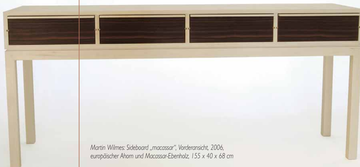
Martin Wilmes: Sideboard „macassar“, Vorderansicht, 2006, europäischer Ahorn und Macassar-Ebenholz, 155 x 40 x 68 cm