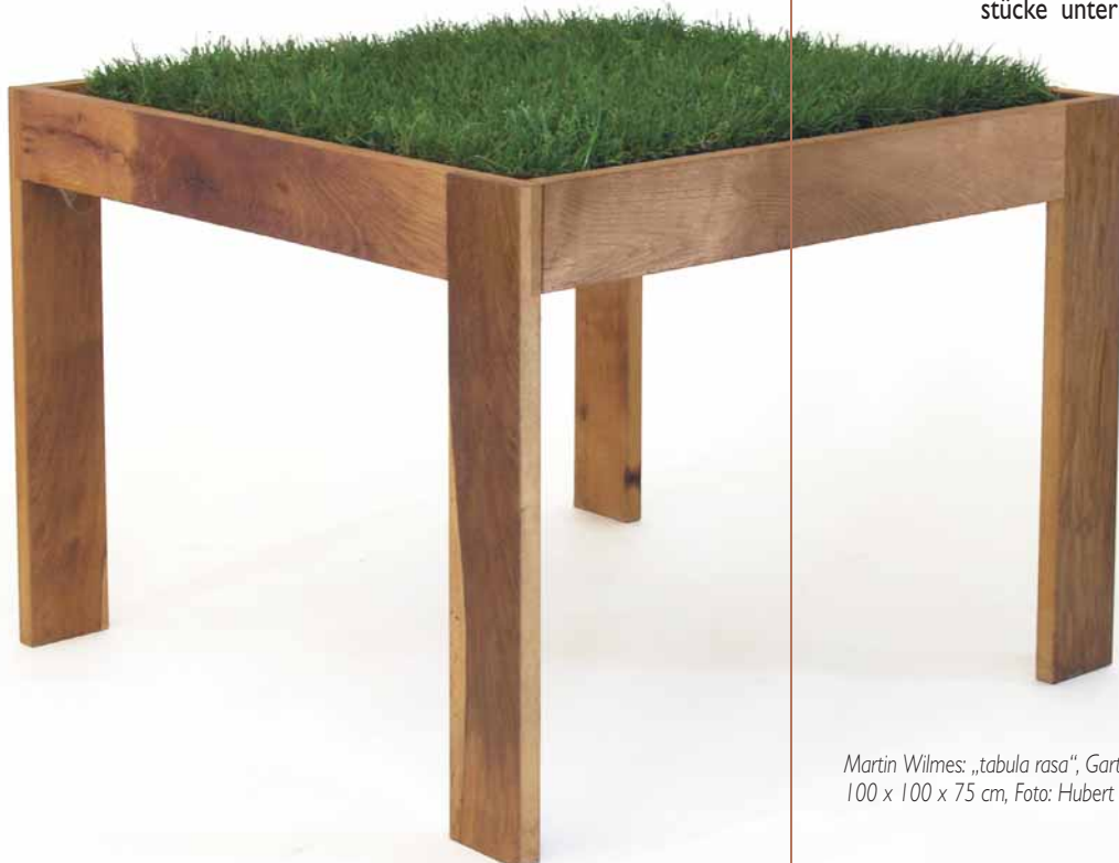
Martin Wilmes: „tabula rasa“, Gartentisch, 2005, alte Eiche, Sportrasen, 100 x 100 x 75 cm

Auch der seit einigen Jahren von Wilmes in vielen unterschiedlichen europäischen und exotischen Hölzern hergestellte Sitzhocker ist von klarer Linearität des Formentwurfs geprägt. Beide Seitenteile und die Sitzfläche des Hockers sind von einem Brett genommen, dessen Maserungsverlauf durch die gerundeten Verbindungsstücke unterbrochen wird. Das Material