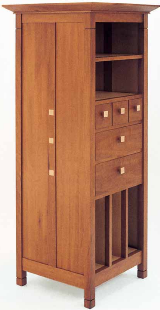
Martin Wilmes: schmaler Schubkastenschrank, 1996, echter Birnbaum, Ahorn, massiv, 50 x 50 x 154 cm