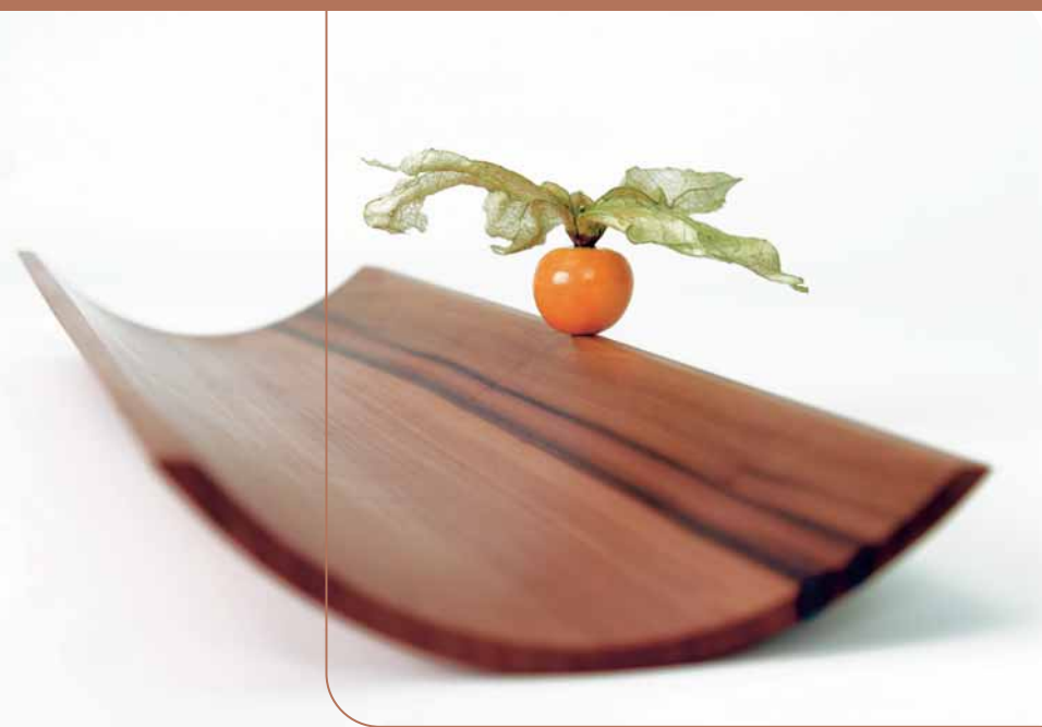
Martin Wilmes: Schale, 2007, Elsbeere, massiv, gekehrt, 54 x 13 x 3 cm

dieser Stücke besteht aus Streifen derselben Bohle, die zu einem Klotz zusammengeleimt werden. Aus den zwei Teilen des auseinander geschnittenen Klotzes werden dann die Rundung herausgearbeitet. So ergibt sich eine sehr differenzierte Holzoptik beim fertigen Möbel, da einmal die Fläche mit der Maserung ansichtig ist und in den Rundungen die markante Zeichnung des Hirnholzes.