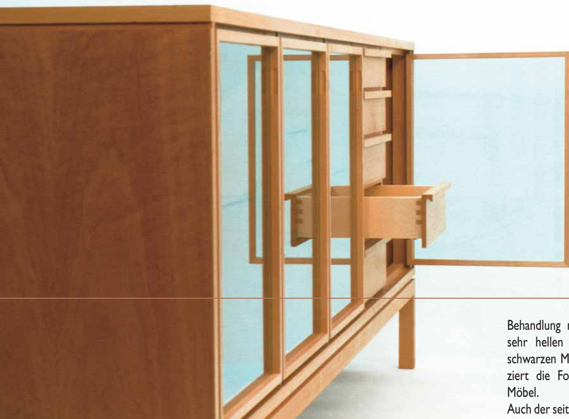
Martin Wilmes: Anrichte, 2004, gedämpfter Spitzahorn, Glas, 220 x 65 x 42 cm

Behandlung mit weiß pigmentiertem Öl sehr hellen Ahornholzes und des fast schwarzen Macassar-Ebenholzes, zu reduziert die Formensprache der einzelnen Möbel.